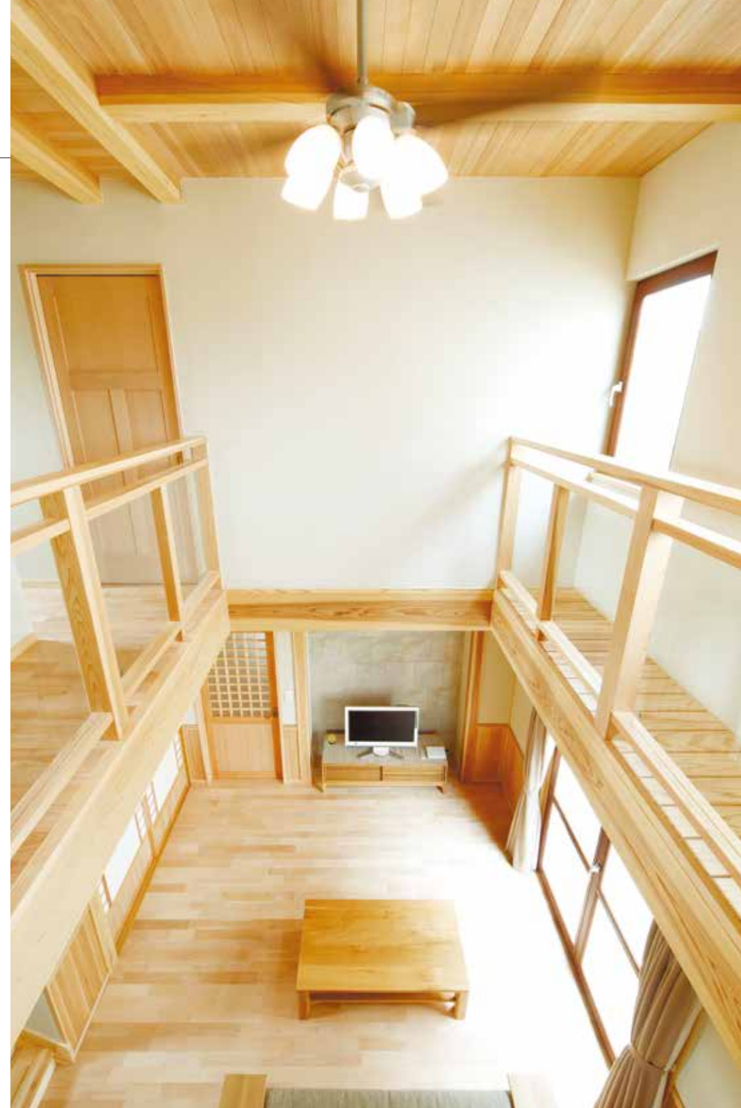
9 右手に設けられているのは、キャットウォーク。自然光があふれ、遊びに昼寝に、猫もののびと暮らせる。