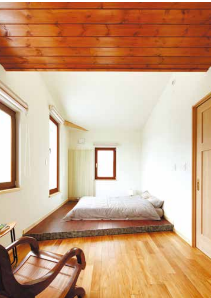
13 天井と床の印象を変えた、スタイリッシュな主寝室。目線を低く暮らす提案型の空間となっている。