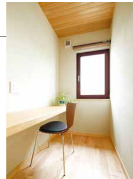
7 2階、主寝室脇に設けられた書斎スペース。セミプライベート空間を創出している。