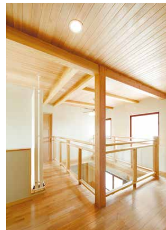
8 自然素材のあたたかさがあふれる、2階ホール。裸足で歩いて心地良い、一年中快適な住空間だ。