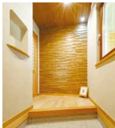
11 玄関を入った正面は、陰影の美しさが映える壁材で住まいの顔を演出している。