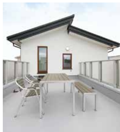
12 ガレージ上の広々バルコニーは、まるでプライベートガーデン。仲間も集える多目的スペースだ。