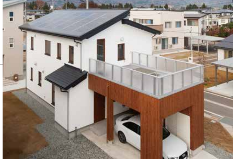
10 屋根一体型で美しいソーラールーフ、自然素材をアクセントにしたガレージも印象的な外観だ。