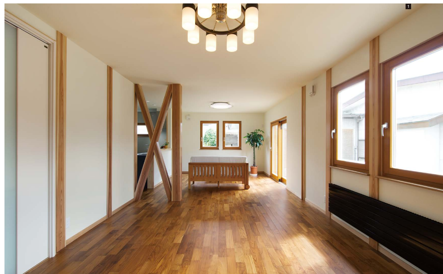
1 広々23帖大のリビング・ダイニング。無垢材のフローリング、天然素材の壁に包まれた健康空間。木のぬくもりと調湿作用で一年中心地よい。