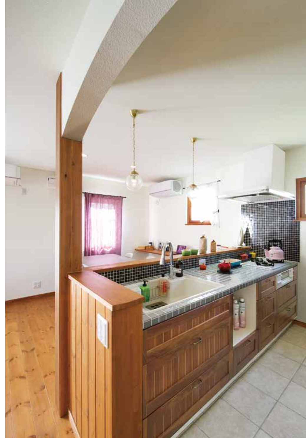
オリジナル仕様が自慢のキッチン。カラーセレクトにもこだわったリネン100%のオーダーカーテンは、昼と夜とで表情を変え空間を演出する。