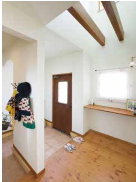
お客様と家族の動線を分けた、広くて明るい玄関。毎日使う帽子やバッグはすぐに取り掛たりしやすいが、玄関ドア側からは目隠しとなっている。