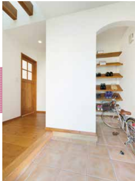
吹抜の開放感が気持ちの良い玄関設計。奥の靴棚はナメに作り付けられ取り出しやすく、ディスプレイ機能も兼ねたアイデア収納。