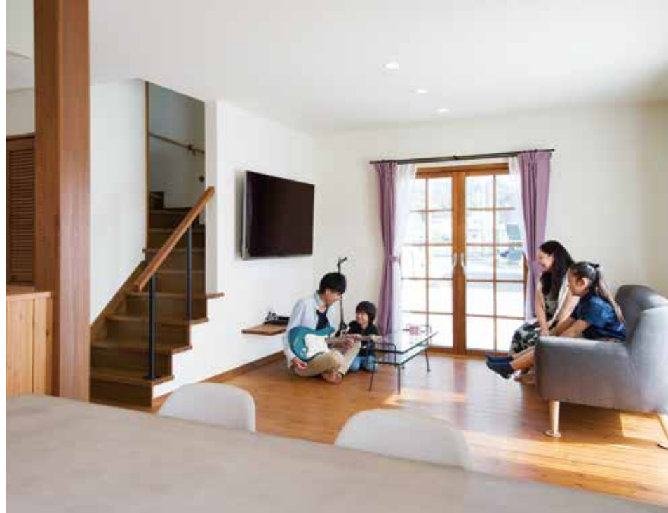
ご主人のギターもディスプレイできるようになった、ゆったりリビング。壁掛けテレビにすることを事前に相談し、配線は表に出ないよう壁面に収めてあるのもポイントだ。