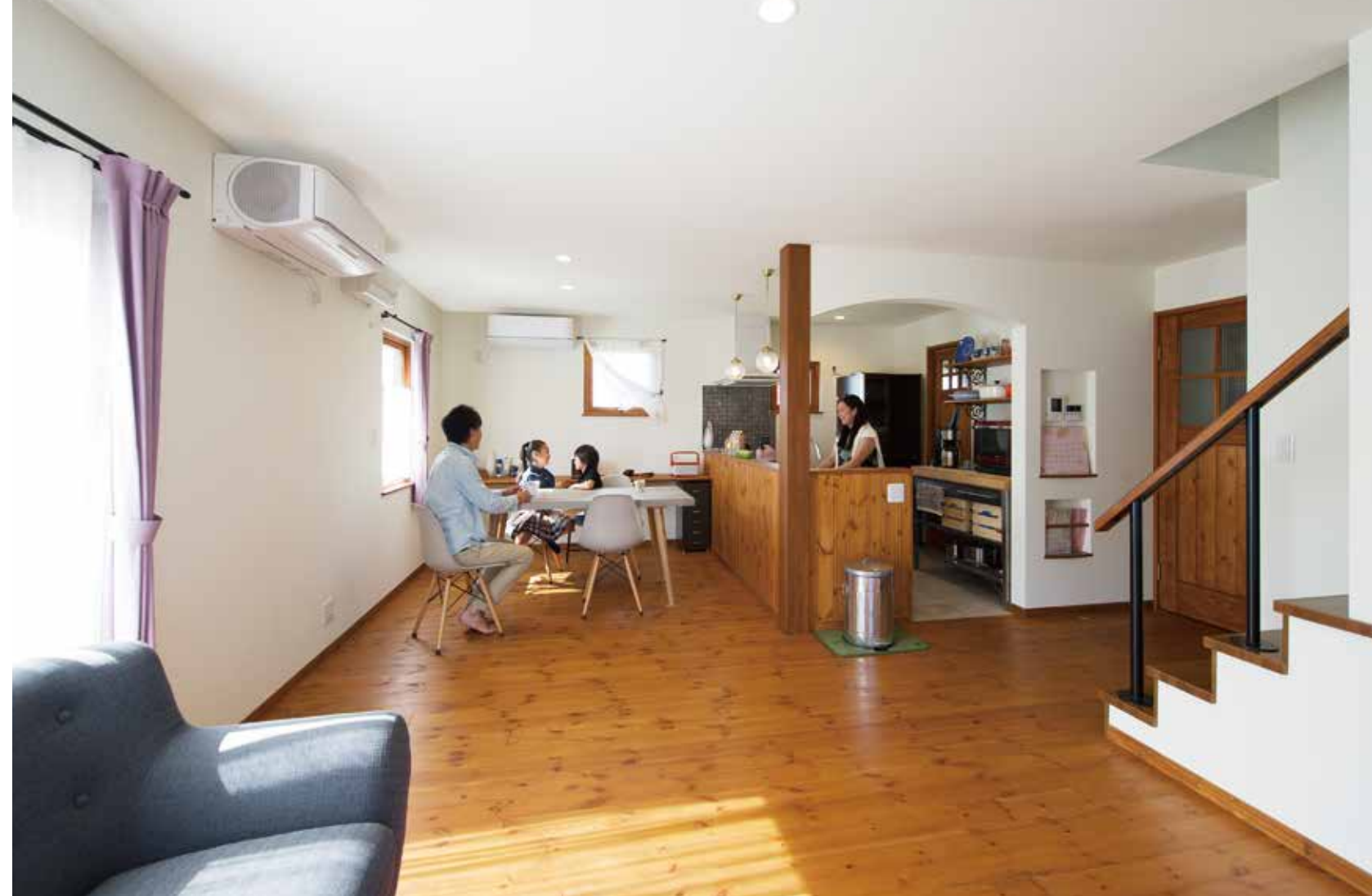
「おうちカフェ」のようなコーディネートがあたたかみを添えるLDK空間。キッチン入口のアーチ型にもこだわりが。