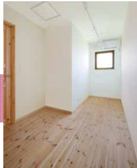
梅雨や冬の時期も天気を気にせずたっぷり干せる、2階の物干しスペースも使い勝手が良い。