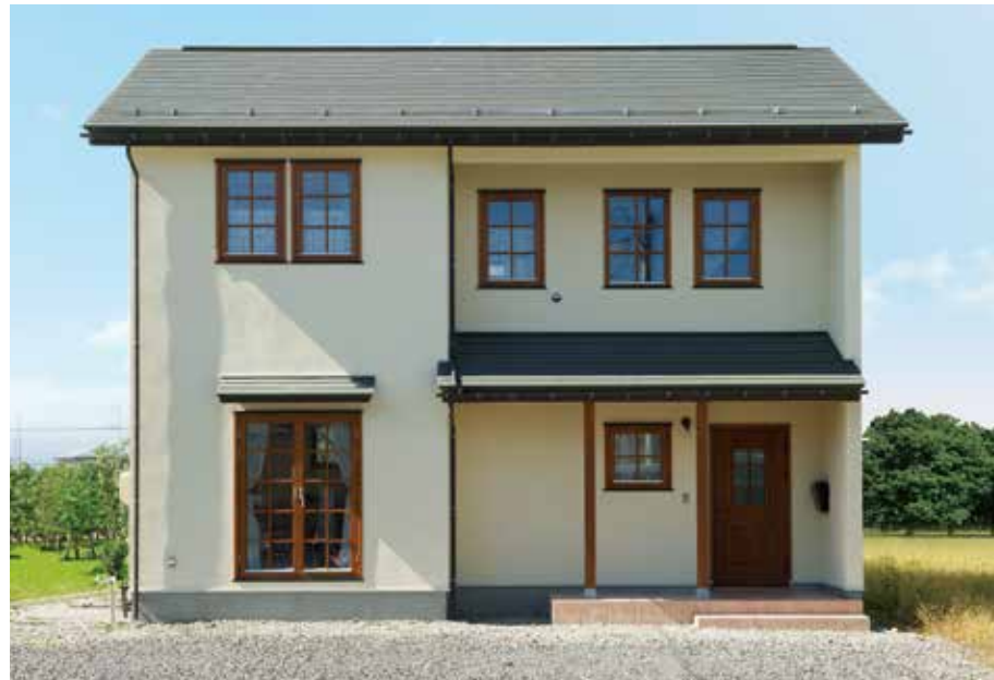
十字格子のついた木製サッシがアクセントを加える外観。カフェ風の落ち着いたトーンでセンスアップ。