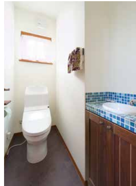
ブルー系のモザイクタイルをアクセントに、トイレもトータルコーディネート。