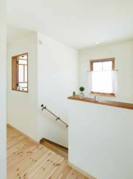
無機質になりがちな2階ホールにも、木製サッシと木のあたたかみが優しくあふれている。