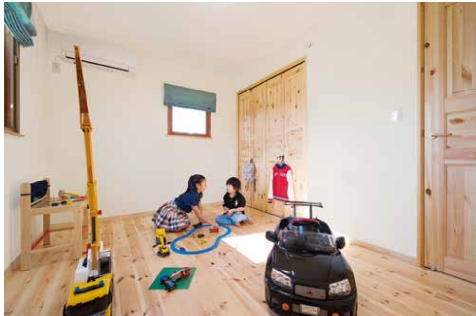
ムク材のあたたかみが心地よい、明るい子ども部屋を2階に2室配置。こちらは息子さんの部屋。「自分だけの部屋ができて嬉しい!」、子どもたちも大満足の様子。