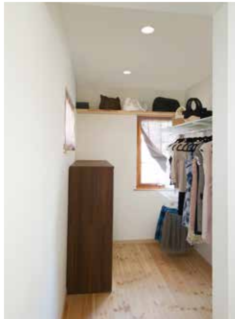
主寝室のウォークインクローゼット。換気もできるような窓を設置。ハンガーパイプは棚を追加したり、好みの高さに調節できる。