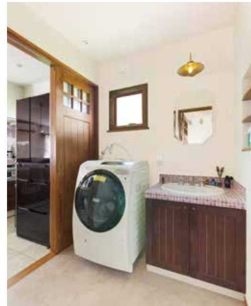
洗面台のモザイクタイルはピンクパープルが基調。キッチンと隣り合わせの空間で、家事動線もスムーズだ。