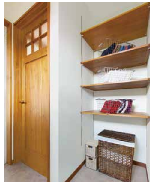
脱衣所に設けた奥行きたっぷりの収納棚の使い勝手も良い。チェッカーガラスの小窓のある木製ドアなど、細部にまでこだわりが。